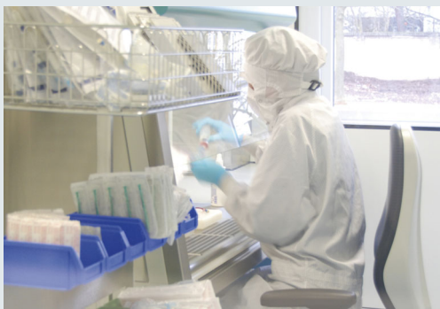
Arbeiten im Reinraum unter strengsten Hygienevorgaben